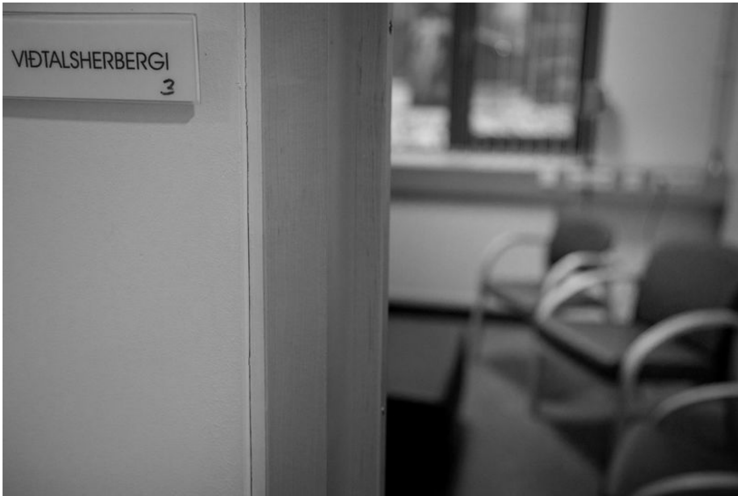
Barna- og unglíngageðdeild Landspítala, BUGL.

Við erum því í kapphlaupi við tímann, ekki bara út af því að hann sé í lífshættu, heldur einnig vegna þess að þegar hann verður 18 ára þá er réttur okkar að óska eftir aðstoð fyrir hann enginn,” segja þau.